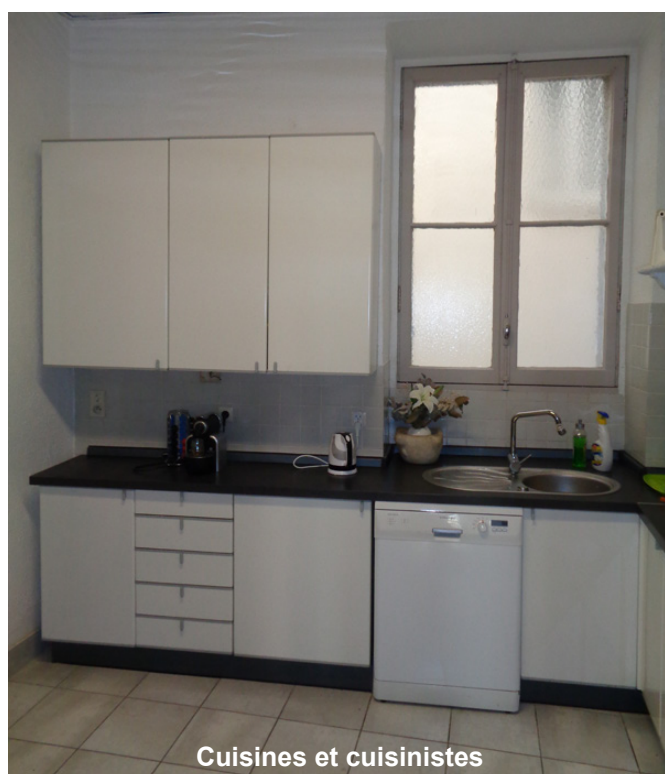
Cuisines et cuisinistes